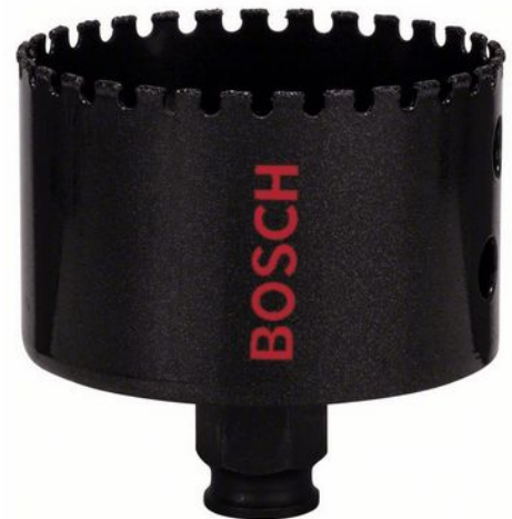
Image du produit, emballé