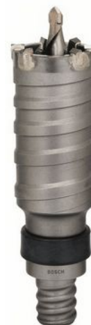
Image du produit, emballé