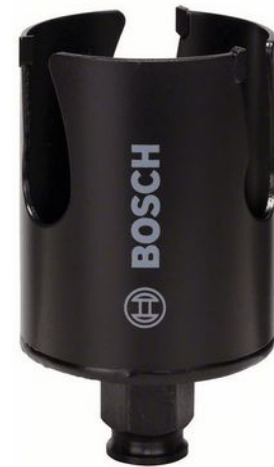
Image du produit, emballé