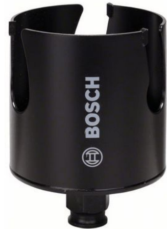
Image du produit, emballé