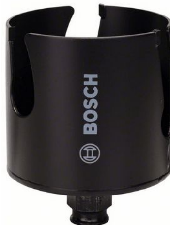
Image du produit, emballé