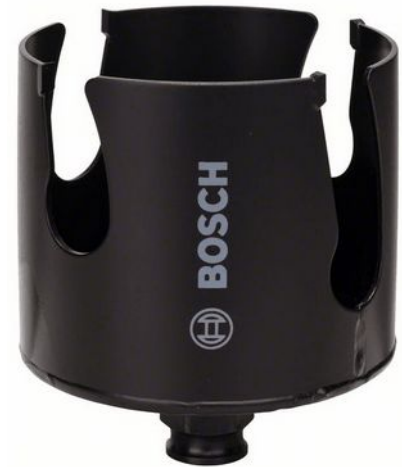
Image du produit, emballé