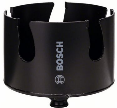
Image du produit, emballé