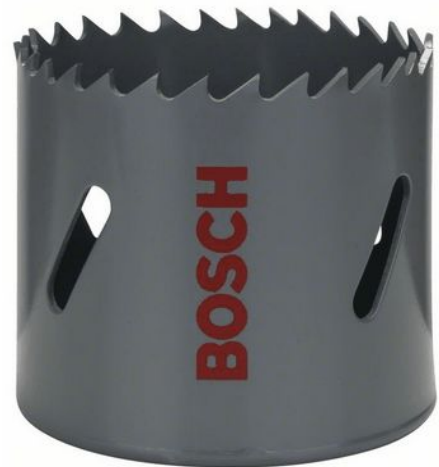
Image du produit, emballé