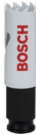
Image du produit, emballé