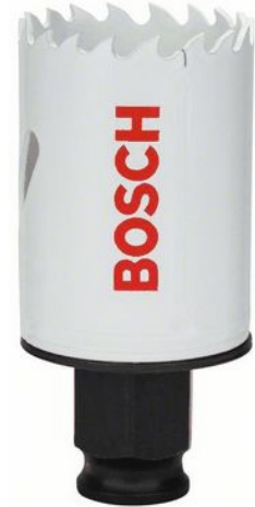
Image du produit, emballé