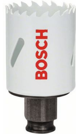
Image du produit, emballé