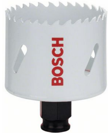
Image du produit, emballé