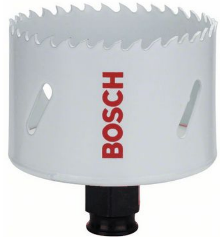
Image du produit, emballé