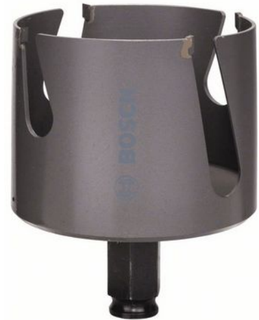
Image du produit, emballé