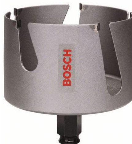
Image du produit, emballé