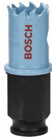
Image du produit, emballé