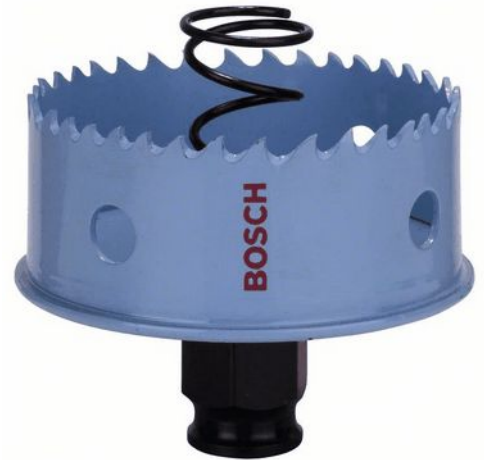
Image du produit, emballé