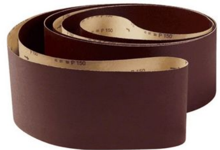
Image produit, pas emballé