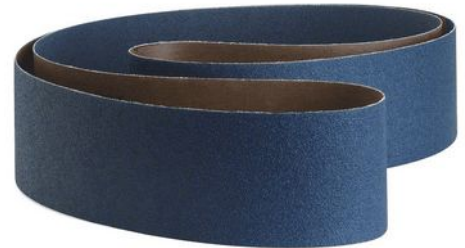
Image produit, pas emballé