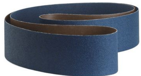
Image produit, pas emballé