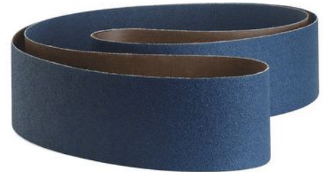
Image produit, pas emballé