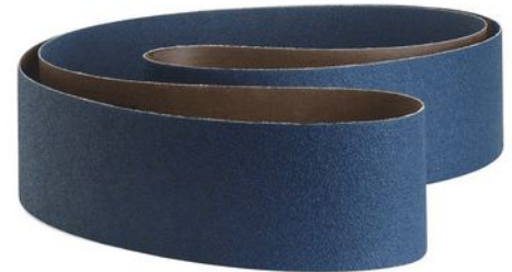
Image produit, pas emballé