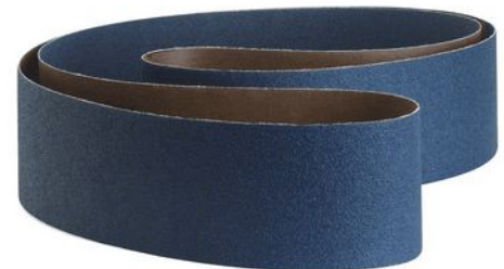
Image produit, pas emballé