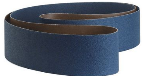
Image produit, pas emballé