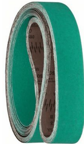
Image du produit, emballé