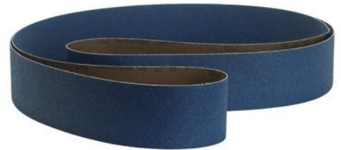
Image produit, pas emballé