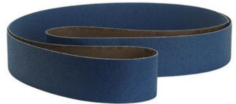
Image produit, pas emballé