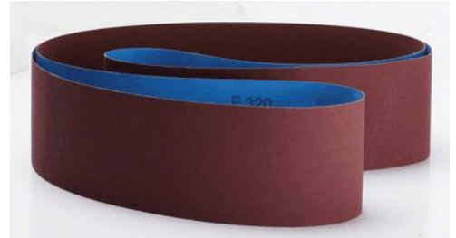
Image produit, pas emballé