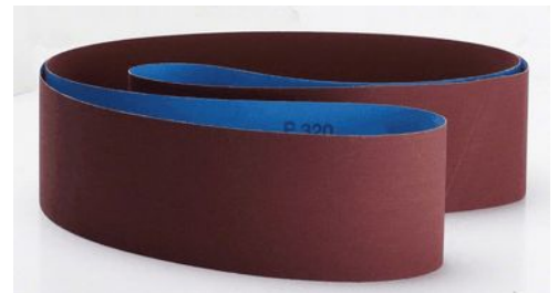
Image produit, pas emballé