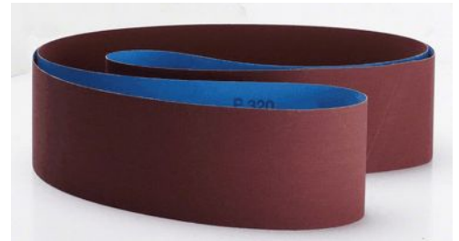
Image produit, pas emballé