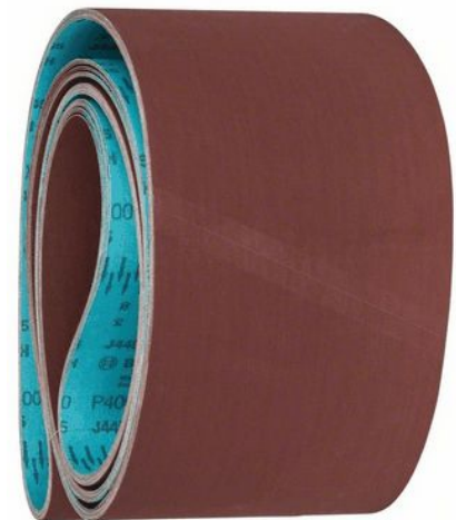
Image du produit, emballé