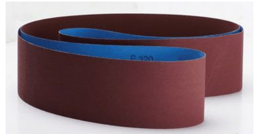
Image produit, pas emballé