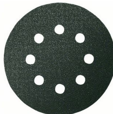
Image produit, pas emballé