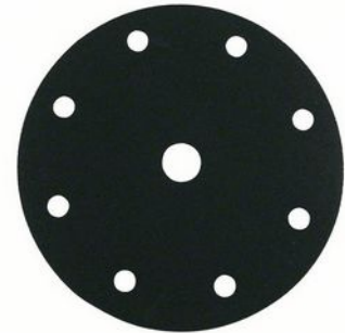
Image produit, pas emballé