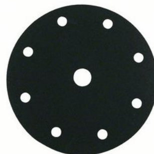
Image produit, pas emballé