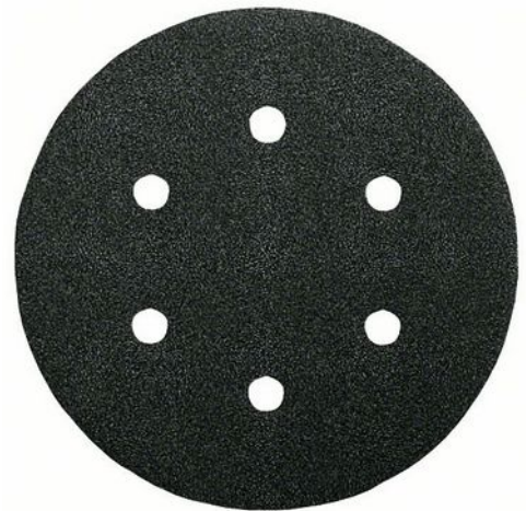
Image produit, pas emballé