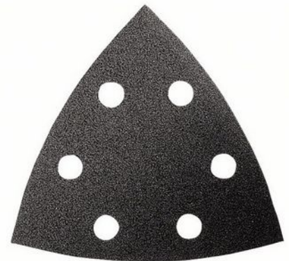
Image produit, pas emballé