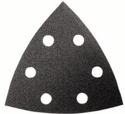
Image produit, pas emballé