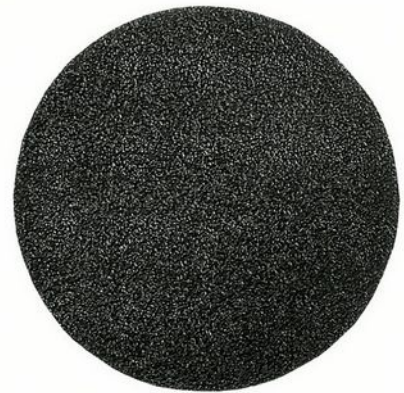
Image produit, pas emballé