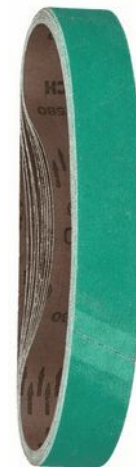
Image du produit, emballé